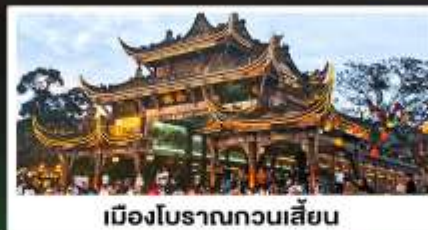
เมืองโบราณทวนเสียน