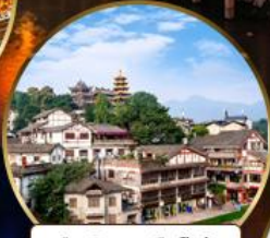
เมืองโบราณฉือจี้โข่ว