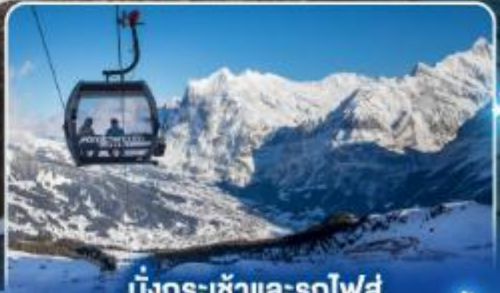
นั่งกระเช้าและรถไฟ สุดอลเวงจากเจนีวา