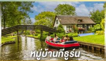
หมู่บ้านทีรูร์น