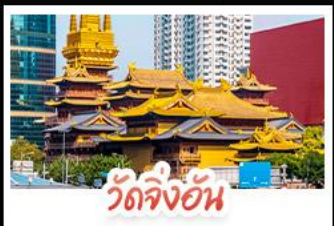
วัดจิ่งอัน

ล่องเรือสุดโรแมนติกแม่น้ำหวงผู้ จักรีสเทียนอันเหมิน จักรีสใหญ่ที่สุดในโลก ใจกลางประวัติศาสตร์จีน พระราชวังต้องห้าม พระราชวังโบราณสุดอลังการ มรดกโลกยูเนสโก ถนนนานกิง แหล่งช้อปปิ้งสุดฮิต แบนด์เนม ของฝากเพียง