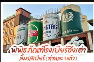
พิพิธภัณฑ์โรงเบียร์ชิงเต่า คิมรสเบียร์ (ทานคะ 1 แก้ว)