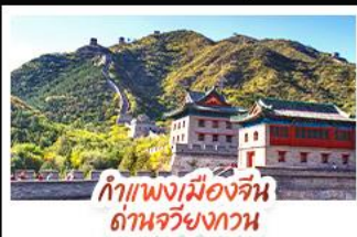
กำแพงเมืองจีน ด้านจวิ๋นกวาน

ส่องเรือสุดโรแมนติกแม่น้ำหวงผู้ ปักกิ่ง..เปิดประตูสู่แดนมังกร ด้วยความอลังการระดับจักรพรรดิ ชิงเต่า..เมืองชายทะเลสไตล์ยุโรป หูหรรษาแบบผ่อนคลาย เซี่ยงไฮ้..มหานครแห่งเอเชีย เมืองที่ไม่เคยหลับใหล