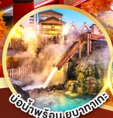
บ่อน้ำพุร้อน ยูซากาตะ