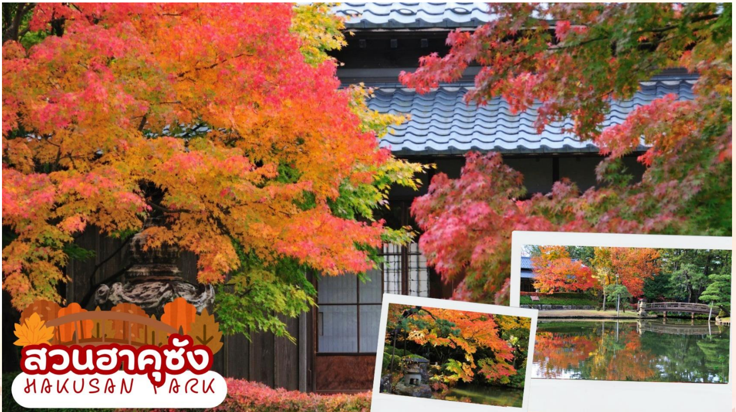
สวนฮาคุซัง HAKUSAN PARK

สวนฮาคุซัง (Hakusan Park) เป็นสวนสาธารณะประจำเมืองนิงะตะ ที่ออกแบบโดยได้รับแรงบันดาลใจจากชาวดัตช์ ตั้งอยู่ติดกับ ศาลเจ้าฮาคุซัง (Hakusan Shrine) และได้รับการยอมรับว่าเป็นหนึ่งในสวนสาธารณะในเมือง 100 อันดับแรกของญี่ปุ่น สวนมีความงามตามฤดูกาลที่หลากหลาย เช่น ดอกซากุระในฤดูใบไม้ผลิ ดอกบัวในฤดูร้อน ใบไม้เปลี่ยนสีในฤดูใบไม้ร่วง และหิมะในฤดูหนาว (ใบไม้เปลี่ยนสีขึ้นอยู่กับสภาพอากาศ)