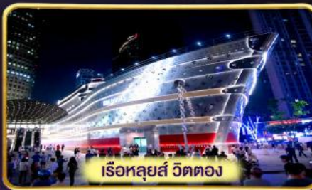
เรือหลุยส์ วัดตอง