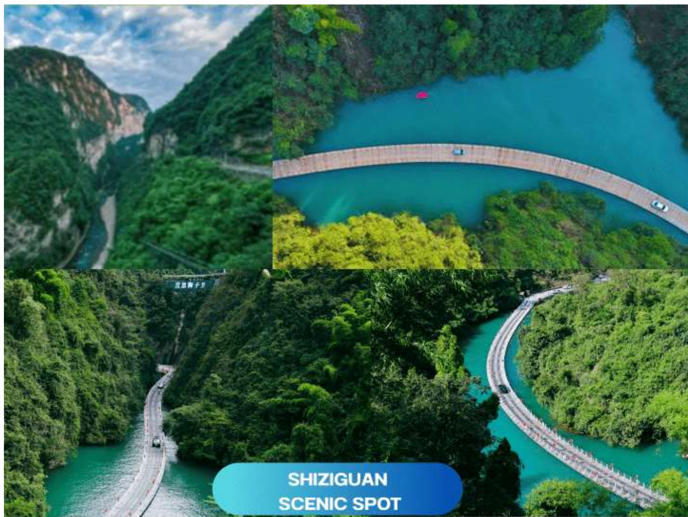
SHIZIGUAN SCENIC SPOT

(ราคาทัวร์รวมค่าเข้าชม) **หมายเหตุ : กรณีที่ทางอุทยานประกาศปิดด้วยเหตุผลของอุทยานฯ ทางบริษัทขออนุญาตสงวนสิทธิ์ไม่คืนเงิน หรือจัดรายการอื่นทดแทน เนื่องจากทางอุทยานได้รวมค่าใช้จ่ายไว้ทั้งหมดแล้ว**