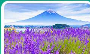
สวนโออิชิปาร์ก