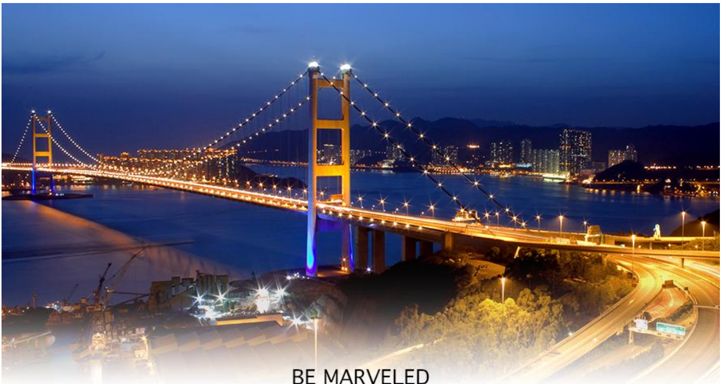
BE MARVELED สะพานแขวนชิงหม่า

17.40 น. เดินทางถึง สนามบินเช็กแล็บก๊อก (CHEK LAP KOK INTERNATIONAL AIRPORT) เขตปกครองพิเศษฮ่องกง หลังผ่านพิธีการตรวจคนเข้าเมืองเป็นที่เรียบร้อยแล้ว รับกระเป๋าสัมภาระ เดินทางโดยรถโค้ชปรับอากาศ (เวลาที่ฮ่องกง เร็วกว่าประเทศไทย 1 ชั่วโมง)