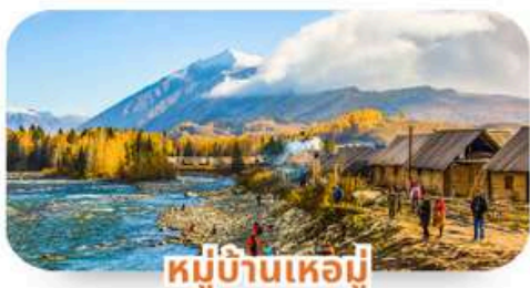
หมู่บ้านเหอมู่่