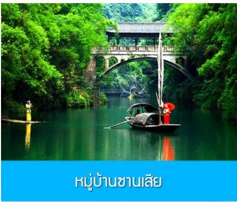
หมู่บ้านซานเสี