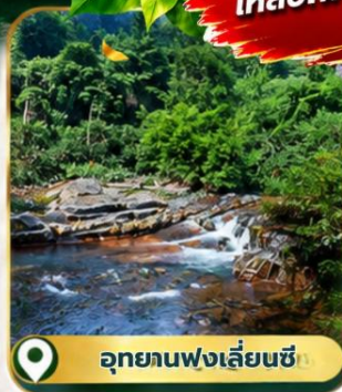
อุทยานฟงเลี่ยนซี