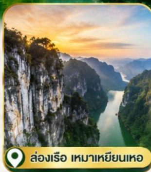
ล่องเรือ เขี้ยวเขือ