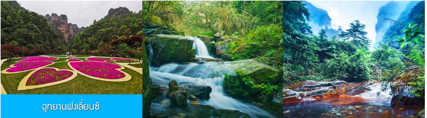
อุทยานฟงเลี่ยนซี