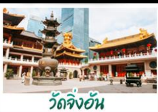
วัดจิ้งอัน