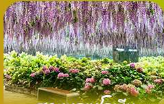
สวนนกเป็ดน้ำ