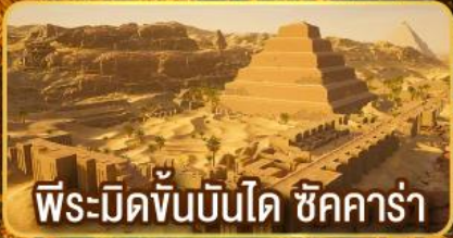
พีระมิดขั้นบันได ชิคคาร์่า