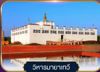
วิหารมายาเกวี