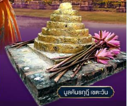
มูลคันธกุฎี เขตเววัน