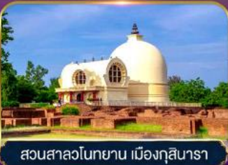
สวนสาละวินทยาน เมืองกุสินารา