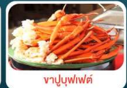
ชาบูบุฟเฟ่ต์