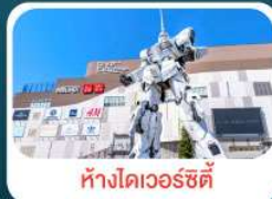
ห้างไดเวอร์ซิตี