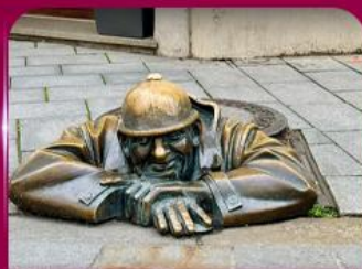
เซลฟี่คูคูมิลา บราติสลาวา