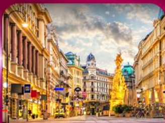
ชมเมืองโรมานติก เวียนนา