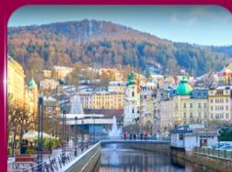
เมืองสปาแสนสวย คาร์โลวี วารี