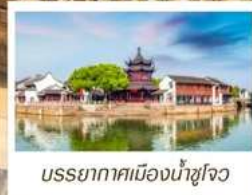
บรรยากาศเมืองน้ำซูโจว