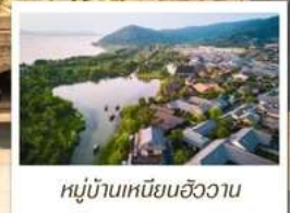
หมู่บ้านเหนียนฮิววาน

🗑️ โหลด 23 KG. x1 ทั้งไป - กลับ ✓ พรีเมียมทิวทัศน์ ✓ ไม่เข้าร้านรัฐบาล ✓ ทิวทัศน์รูปเล็ก ✓ รวมค่าเข้าชมสถานที่ตามโปรแกรม