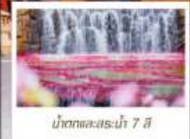
น้ำตกทะเลสาบน้ำ 7 สี

🗑️ โหลด 23 KG. x1 ทั้งไป - กลับ ✓ ฟรีนียบตัว ✓ ไม่เข้าร้านรัฐบาล ✓ ทิวทัศน์แปลก ✓ รวมค่าเข้าชมตามที่ตามโปรแกรม