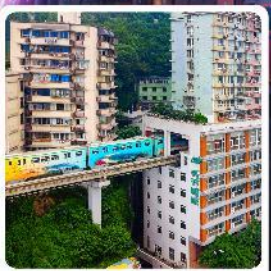
รถไฟฟ้าฉงชิ่ง

ไฮไลท์! อุทยานแห่งชาติหลุมฟ้า มรดกโลกระดับ 5A รถไฟฟ้าทะลุติ๊ก ตึกตะก๊อบ อลังการการแสดงสียงหยาด