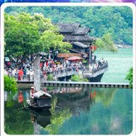
หมู่บ้านชาวน้ำเขียว