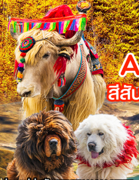
ถ่ายรูปคู่สุนัข TIBETAN MASTIFF จามรี และแพะ ทะเลสาบยิมดรก

สี่ส้านแห่งฤดู บนดินแดนแห่งศรัทธา หลินจื่อ • ลาซา