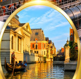
Venice Water City