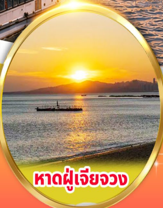
หาดผู้เจียวจง

พิเศษ! อาหารซีฟู้ด+อาหารบึงย่าง เกียวสไตล์ต้าเหลียน