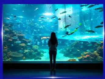
อควาเรียมยักษ์รูปเต่า