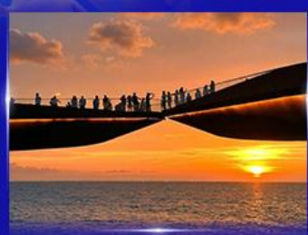
สะพานจูบ Sunset Town