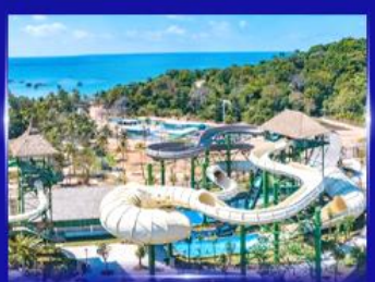
สวนสนุก Sun world Hon thom