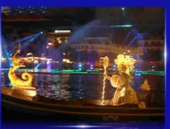
ชมโชว์เวนิสจำลอง แกรนด์วิลด์