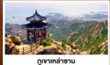
ภูเขาเหล่านาน