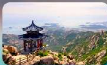
ภูเขาเหลาชาน