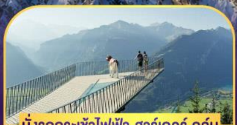
นั่งรถกระเช้าไฟฟ้า ฮาร์เตอร์ คูลัม