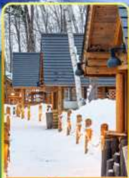
มึงเกิ้ลเกอเร