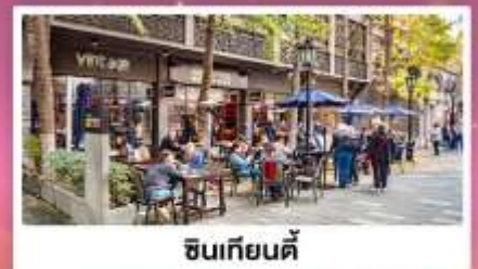
ช้อปปิ้ง