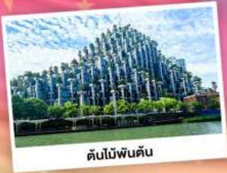
ต้นไม้พันต้น