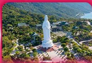
องค์กวนอิม วัดหลินอิ่ง