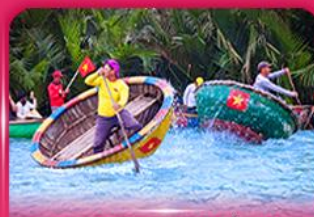
ล่องเรือกระดัง หมู่บ้านกิมทาน