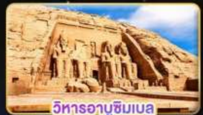
วิหารอบูซิมเบล

น้ำหนักกระเป๋า 23Kg. (ใบเสร็จรับน้ำหนัก สะดวกสบาย)