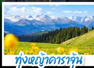
ทุ่งหญ้าคาราจัน