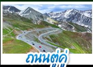
ถนนตุ๋กู่

อุทยานเซียงต้า - ไช่หลี่มู่ คาราจัน - ถนนตุ๋กู่ ตลาดแกรนด์บาซ่า - กุ้งเหวินคาราจัน