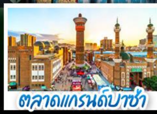
ตลาดแกรนด์บาซ่า