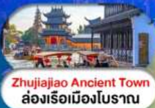
Zhujiajiao Ancient Town ล่องเรือเมืองโบราณ

เซี่ยงไฮ้ ดิสนีย์แลนด์ เมืองโบราณจูเจียเจียว