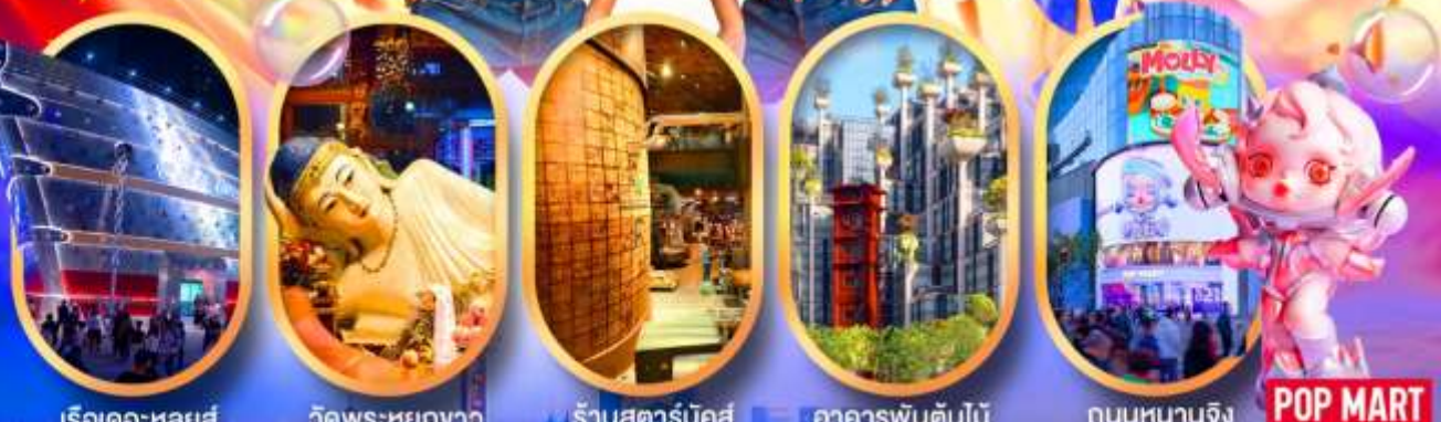
เรือคะหลุยส์ วัดพระหยกขาว ร้านสตาร์บักส์ อาคารพินตันไม้ ถนนหนานจิง POP MART

เซี่ยงไฮ้ ดิสนีย์แลนด์ เมืองโบราณจูเจียเจียว