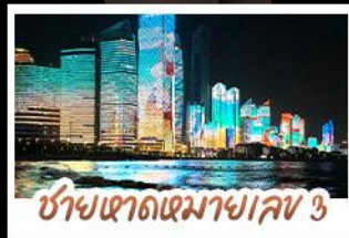
ซ่าเซาดเซมาเยล 3