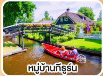
หมู่บ้านทีร์ูร์น