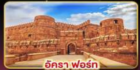
อัครา ฟอร์ต